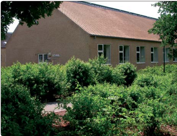
Herbariebygningen i Universitetsparken mellem biokæden ved Ole Worms Allé og Matematisk Kantine. Herbariet huser tørrede og pressede planter, samt ca. 10.000 blomster og frugter konserveret i alkohol.

Den 1. juli 2012 blev Aarhus Universitets Herbarium, kendt som Herbarium Jutlandicum , lagt ind under Science and Technology Museerne, hvor det fremover vil indgå på linje med de videnskabs-historiske samlinger og de levende planter i væksthuse.