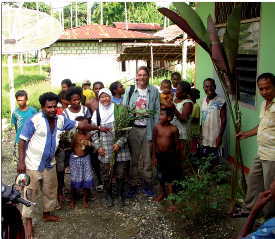
Feltarbejde i New Guinea. Herbariets samlinger øges løbende, dels ved udveksling af materiale med andre herbarier, dels ved indsamlinger lavet som dokumentation i forbindelse med forskningsprojekter.

Kiel. Gartnerne kørte så mange ture med instituttets VW Transporter, at den ved grænsen blev kendt som “blomstervognen fra Aarhus”.