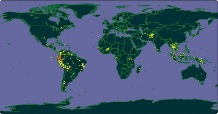
Herbariet leverer et stort datasæt til Global Biodiversity Facility (GBIF). På GBIF kortet ses data leveret fra herbariet som gule til røde områder. Jo mørkere farven er, jo flere data findes i det pågældende område. Grafik: www.gbif.org .

Thailand og Burkina Faso er blandt de vigtigste i verden. Blandt plantegrupper er palmer, græsser, ingefær, bregner og bælplanter rigt repræsenteret. Specielt palmesamlingen er af stor international betydning. Men der er også en stor og vigtig samling af danske planter, især fra det jyske område.