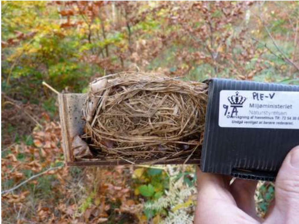
Figur 6: Redetype med meget græs