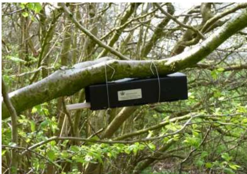
Figur 3. Røret op-hænges med fx en tynd stålwire. Rederøret spændes godt fast, så det ikke forskubbes eller gynger i blæsevejr. Rørets sættes vandret eller med hældning mod åbningen.