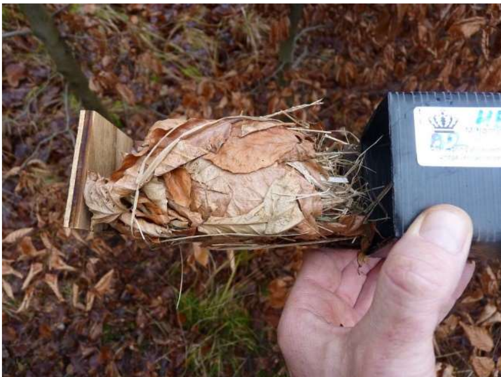
Figur 7. "Klassisk" redetype med bøgeblade og kerne af bl.a. græs.