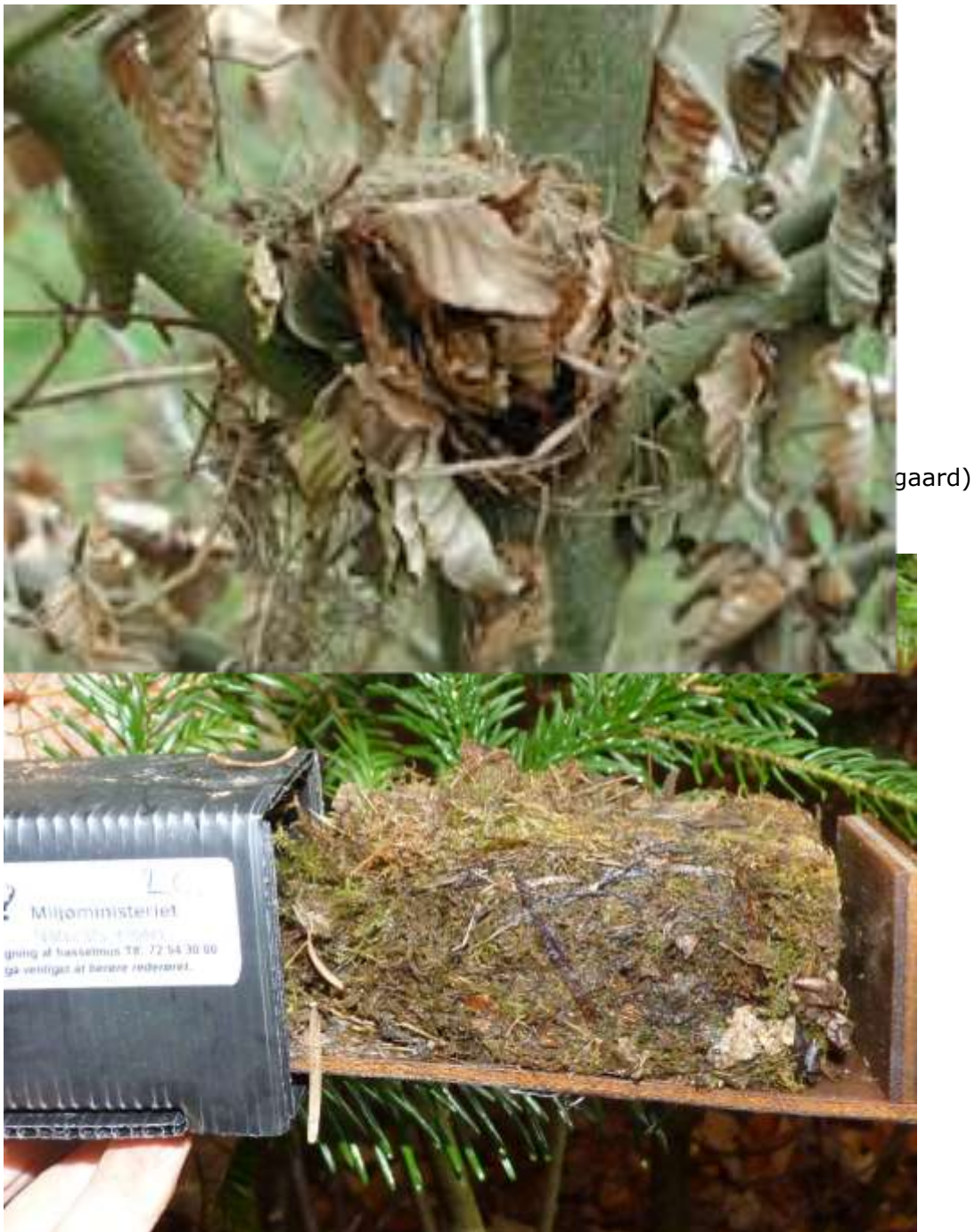
Figur 5. Redetype med meget mos. Bemærk at rederøret er opsat i ædelgran