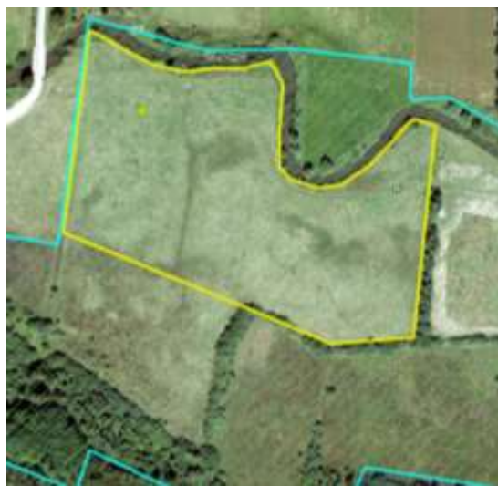
Figur 1b. Endelig afgrænsning af forekomst med hovednaturtypen eng (blå signatur), der består af to delområder med hhv. meget tør og meget våd eng. Da det tilfældige punkt (grøn prik) ligger i det tørre delområde mod nord, foretages den endelige afgrænsning af dette (gul signatur). Der effektovervåges således kun en mindre, men mere homogen, andel af det samlede forvaltede eng-areal.

For forekomster med "ikke § 3-natur" opsøges det første tilfældige punkt og det vurderes om det ligger inden for et areal på mindst 500 m 2 , der formodes at kunne udvikle sig i retning af den hovednaturtype forekomsten er udpeget for. Hvis dette er tilfældet foretages en endelig afgrænsning af det areal punktet repræsenterer. Det kan fx være en permanent græsmark på tør bund, der ved en optimal forvaltning kan udvikle sig mod overdrev. Hvis hele forekomsten med "ikke § 3-natur" har en tilstand, der svarer til en hovednaturtype, og den manglende §3-registrering beror på en åbenlys fejl, forkastes arealet og det indgår ikke i effektovervågningen som dokumentation for udviklingen af nye naturarealer. Hvis dele af forekomsten (fx de vådeste partier af en græsmark) åbenlyst har en tilstand, der svarer til en hovednaturtype, afgrænses forekomsten til udelukkende at dække de områder, der er under udvikling mod natur. Herved sikres, at både det tilfældige og det bedste areal inden for forekomsten, indgår i effektovervågningen som en dokumentation af udviklingen af ny natur.