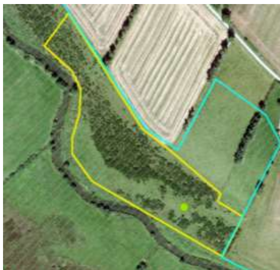
Figur 1a. Overdrevsskrænt, der er registreret som eng i den vejledende § 3-registrering (blå signatur). Arealet forkastes som eng, men kan indgå i effektovervågningen af overdrev (gul signatur), såfremt kvoten for overdrev ikke er opbrugt i den konkrete MST-enhed. Overdrevsarealet, der kan indgå i effektovervågningen omfatter kun en mindre del af overdrevsskrænten.