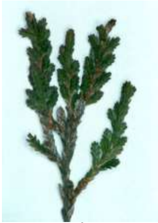
Figur 2.a. Årsskud på hedelyng tidligt på sæsonen. Dette års skud fremstår i tydelige mørkgrønne nuancer og er blot få cm lange.