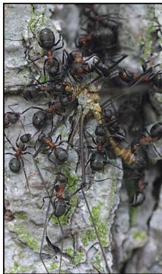
Skovmyrer samarbejder om nedlæggelse og transport af et stort byttedyr.

I fremtiden vil vi undersøge om potentielle byttedyr gene-