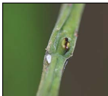
Nærbillede af tyrehornsakaciens nektarier

nektarier en sukkerholdig nektar, som myrerne værdsætter højt. Oftest er de placeret på plantens mest sårbare dele som f.eks. nyudsprungne blade og unge frugter, der endnu ikke har udviklet kemiske forsvarsstoffer mod skadedyr. Her tiltrækker nektarierne myrer, der fjerner de skadedyr, som ellers ville fortære de kemisk ubeskyttede plantedele. Alene i Skandinavien har vi mere end 40 plantearter med sådanne nektarier.