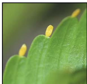
De gule foderlegemer er perfekte myremadpakker.

Andre planter har udviklet små næringsrige foderlegemer, der lige passer i størrelsen til at myrer kan plukke og bære dem. Disse foderlegemer indeholder i modsætning til nektar en del vigtige fedt- og proteinstoffer. De bruges derfor af myrerne til at fodre deres larver med. Igen kan forholdet mellem planter og myrer være livsvigtigt for begge parter, da nogle myrearters larver ikke kan overleve uden en bestemt plantes foderlegemer.