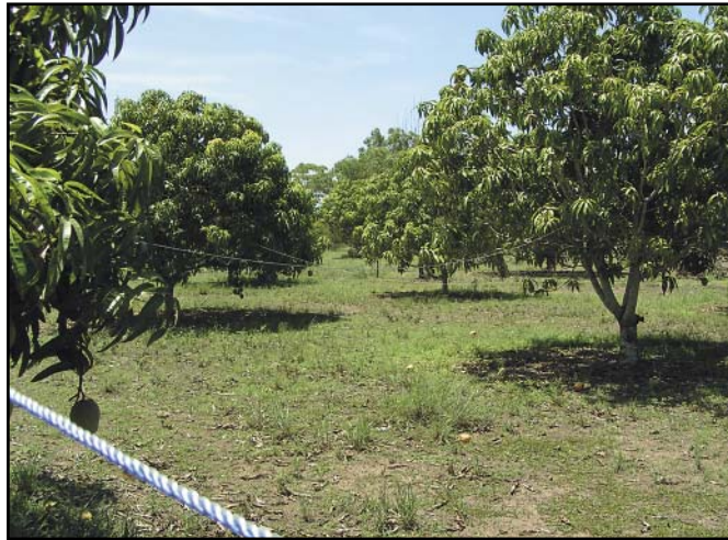
Mangoplantage med reb ("myrebænder") mellem træerne. Brugen af vævermyrer er knap 10 % billigere end omkostningerne ved sprøjtning.

Det viste sig, at bladbillerne forsøgte at undgå at gnave i blade, fra et vævermyreterritorium i forhold til blade fra træer uden myrer. Ligeledes viste det sig, at netop denne myreart markerer sit territorium, der bl.a. inkluderer træernes blade, med langtidsholdbare duftstoffer. Det ser derfor ud til, at alene lugten af myrer kan være