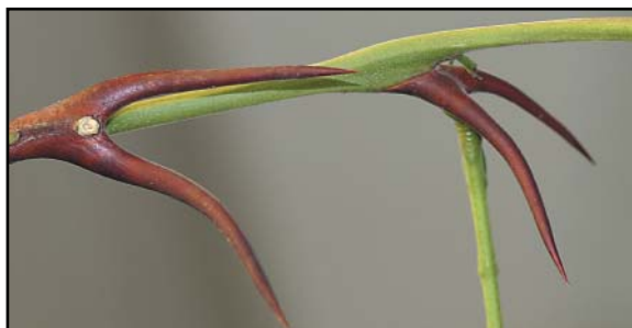
Tyrehornsakaciens hule torne, der fungerer som boliger.

Andre planter har udviklet små næringsrige foderlegemer, der lige passer i størrelsen til at myrer kan plukke og bære dem. Disse foderlegemer indeholder i modsætning til nektar en del vigtige fedt- og proteinstoffer. De bruges derfor af myrerne til at fodre deres larver med. Igen kan forholdet mellem planter og myrer være livsvigtigt for begge parter, da nogle myrearters larver ikke kan overleve uden en bestemt plantes foderlegemer.