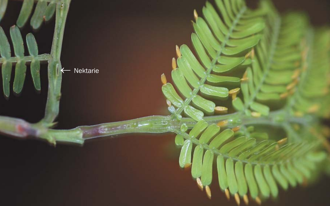
Tyrehornsakacien laver både nektarier og foderlegemer (gule) til myrerne.